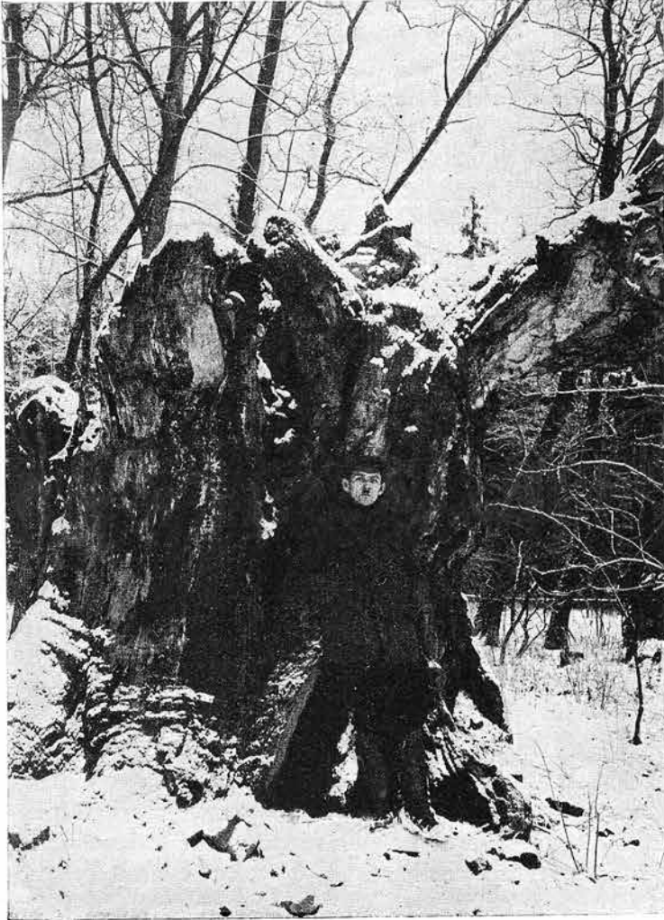
Ryc. 5. Szczątki starego dębu w parku.

w głębi, na wyniesieniu utworzonym przez korzenie. Skręcając okólną ulicą ku południowi, spotykamy na zboczu, wśród zarośli akacjowych, duży okaz dębu zupełnie zdrowego i dobrze jeszcze rosnącego. Grubość pnia wynosi 5,40 m.