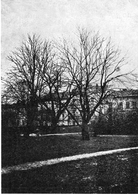
Fot. J. Mądalski

Malus sp. — na szczepionych jabłoniach. Lwów: Cetnerówka; Pasieki Miejskie, Gańczary, Winniczki i Winniki koło Lwowa; Łanowice koło Sambora, w ogrodzie na plebanii; Dubaniowice koło Rudek.