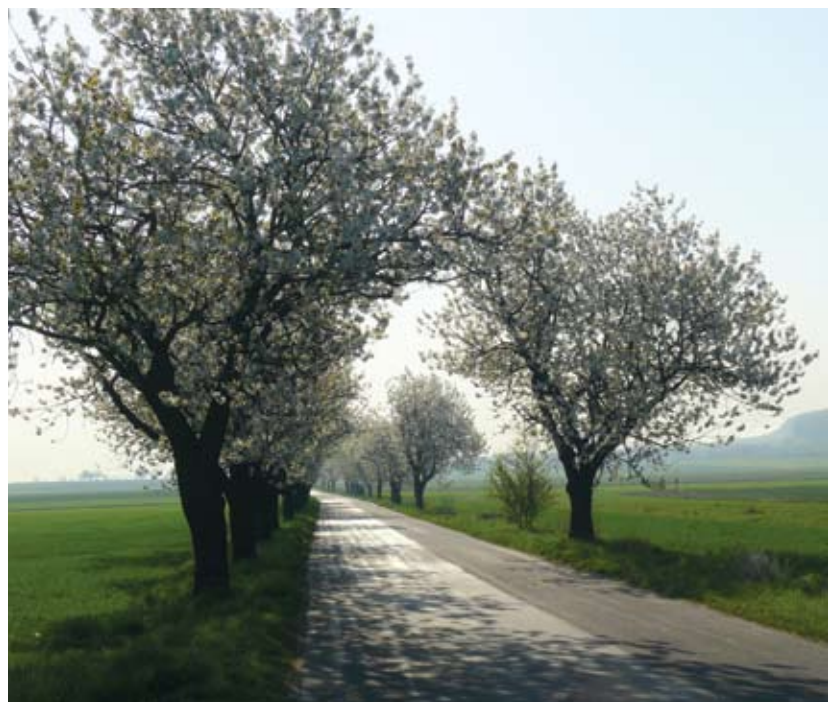
Ryc. 3 Fragment starej alei czereśniowej (aleja 2). Fig. 3. Section of an old cherry avenue (avenue 2).

Gatunki inne niż Prunus avium L., pojawiają się w alejach spontanicznie i nie były tu celowo sadzone. Największą różnorodność takich drzew spotykamy w alei 1, co jest spowodowane tym, że graniczy ona z obszarami o charakterze leśnym, podczas gdy pozostałe aleje mają charakter śródpolny, nie sąsiadują z większymi lasami. Duży udział drzew