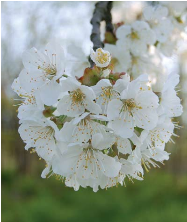
Ryc. 4. Kwitnące drzewo czereśniowe w alei 1 (fot. M. Jańczak-Pieniążek).