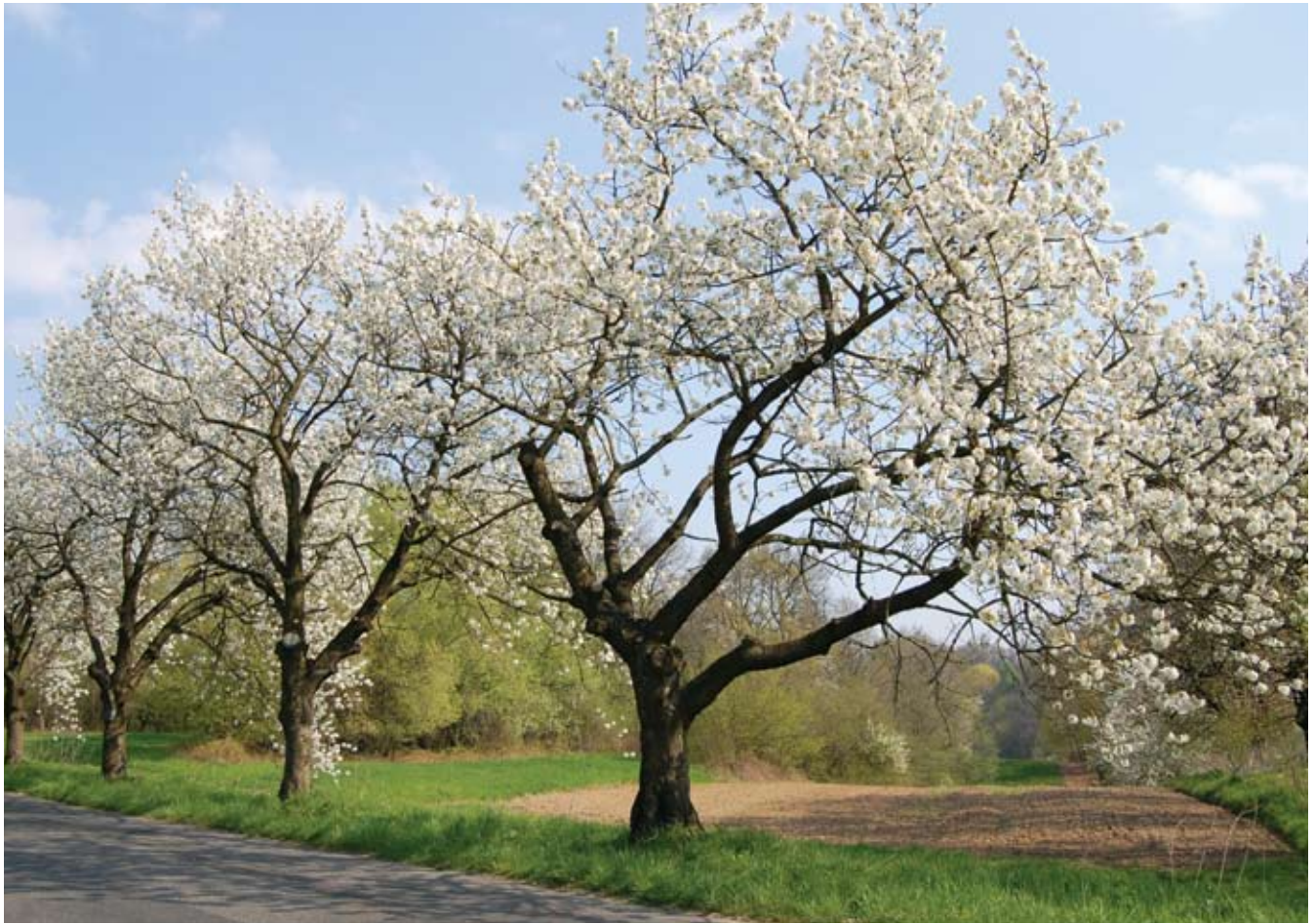
Ryc. 2. Fragment starej alei czereśniowej (aleja 1). Fig. 2. Fragment of an old cherry avenue (avenue 1).

Fritz 2008). Oznaczenia większości odmian dokonał Grzegorz Hodun z Instytutu Ogrodnictwa w Skierniewicach (Hodun 2011); spis odmian oraz ich występowanie w poszczególnych alejach przedstawia tabela 2.